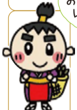
鹿児島県茶生産協会イメージキャラクター